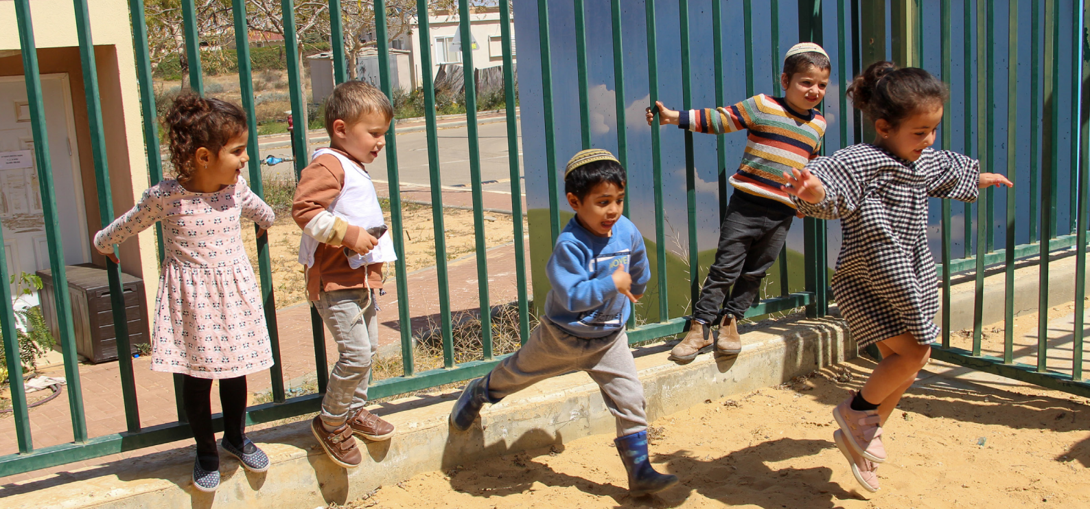
ילדי גן "איתן" חוזרים מהמרכז ליישוב בני נצרים.