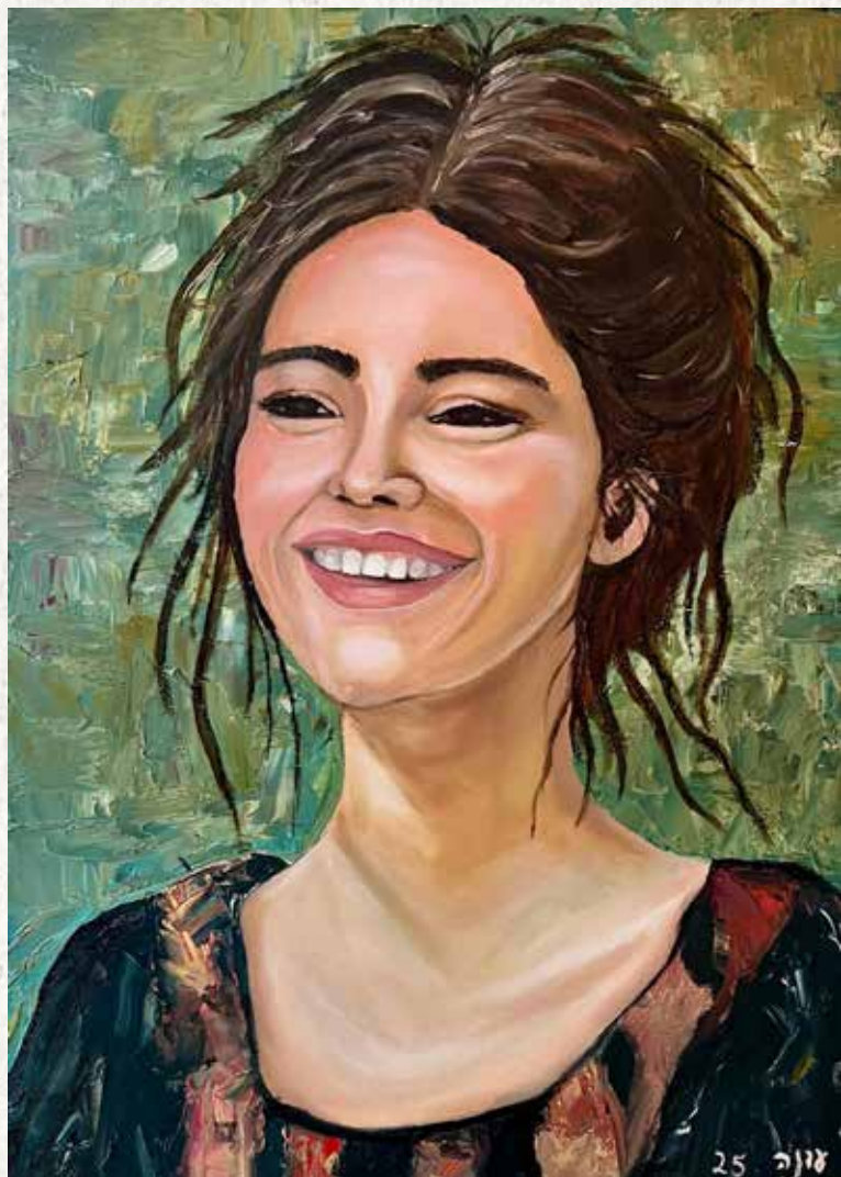
חלון אפשרויות. צבעי שמן, עדנה טמיר