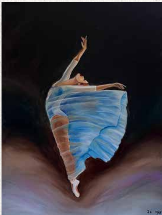
חופש. צבעי שמן, עדנה טמיר